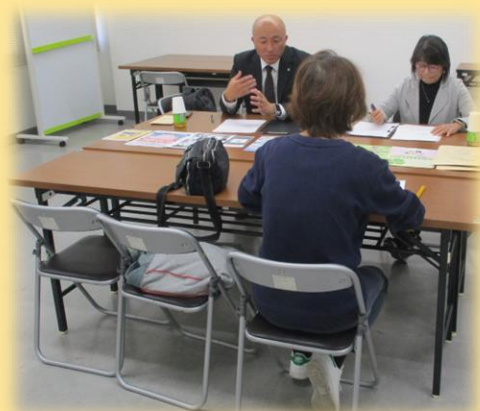
▲個別相談会の様子

弁護士・司法書士・社会福祉士が、成年後見制度に関する疑問や相談にお応えします。毎月の開催日時や申込み開始日につきましては、市政だよりや社協だよりをご覧ください。