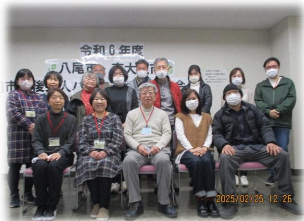
▲研修会後に参加者で集合写真を撮りました。