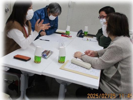
▲グループワークの様子