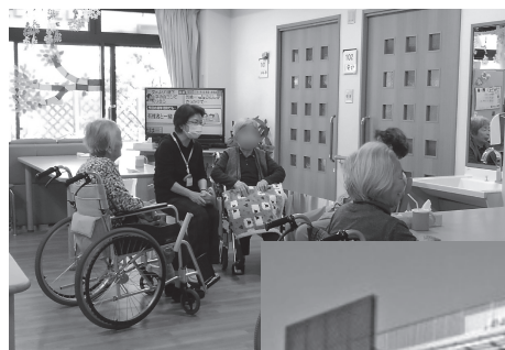
◀共有スペースでの様子

介護施設に預けることに負い目を感じて、ご家族がギリギリまで我慢しているケースもあります。配偶者が一人で抱え込み、生活が破綻してしまっていて、『もう少し、入所が遅かったらどうなっていたか・・・』というようなケースも・・・。ご本人の安全はもとより、ご家族にも「ほっと一息」安心してもらえるように努力しています。