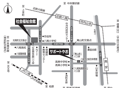
◇社会福祉会館・サポートやおへの道順◇

(徒歩) (社会福祉会館) 近鉄八尾駅より7分 JR八尾駅より10分 (サポートやお) 近鉄八尾駅・山本駅・ 高安駅よりいずれも20分