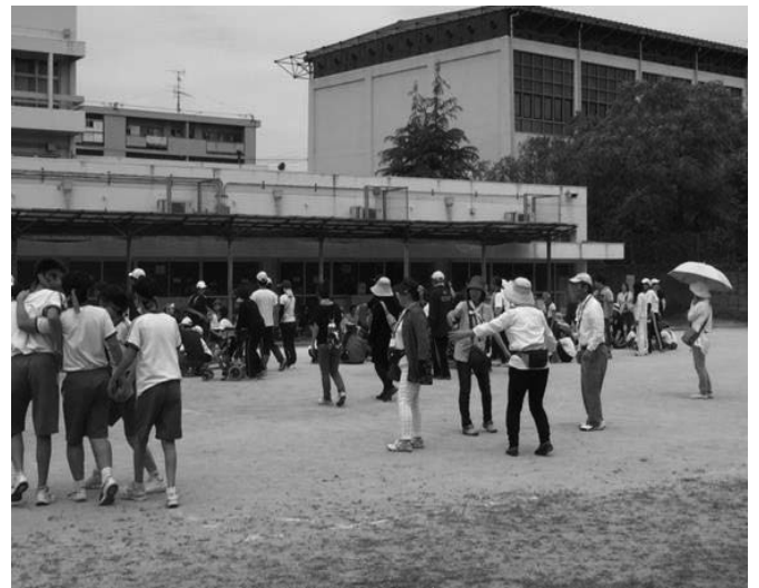
▲ ゲーム「もうじゅう狩り」の様子

八尾市ボランティア連絡会からは12名が参加しました。その他、PTAや青少年指導員など多くのお手伝いの方が集いました。