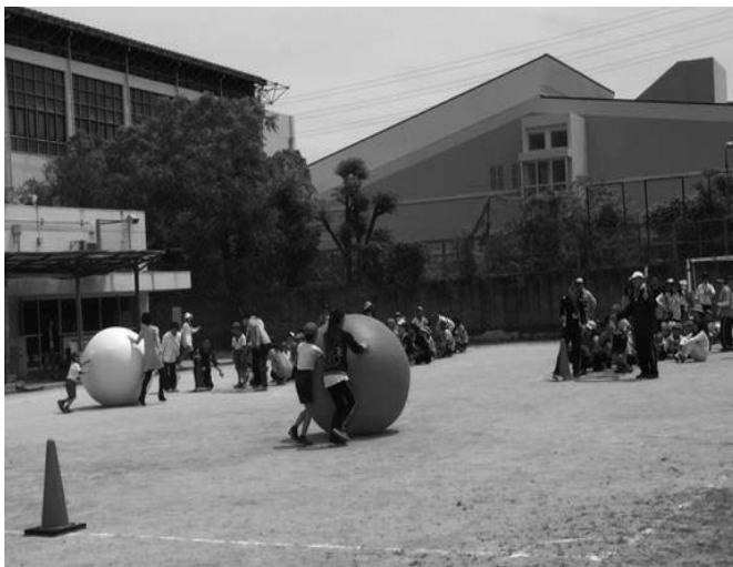
▲ 大玉ころがしの様子

この交流会を通して、子どもも大人も、人とつながる楽しさや大切さを実感できる一日でした。