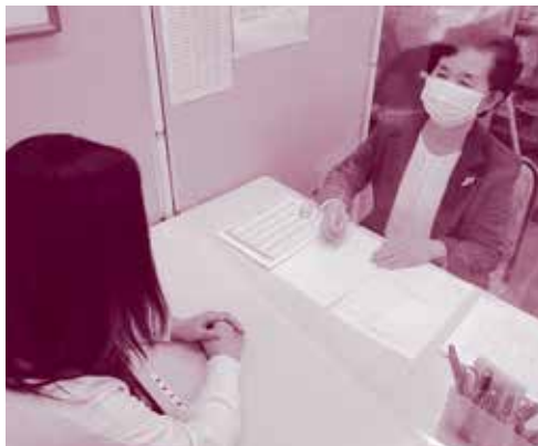
しんばい そうだん ▲心配ごと相談

障がいのある方や高齢者の方など、地域でくらす様々な人を支える地域の人たちを支援する大事なお金になります。 八尾市で集められた募金の約30%は大阪府全体の問題を解決するために使われます。例えば、「災害等準備金」です。これは、大雨による洪水や大きな地震などの災害が起きて、もっと広い範囲で支え合わなければならなくなったときに、募金をすべに使えるお金としてたくわえておくものです。