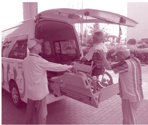
いそう ▲移送サービス

八尾市で集められた募金の約70%は、八尾市の福祉の施設や地域で福祉を支える人たちのために使われています。福祉の施設や地域を支える人たちに、どうして、「募金の力」が必要なのかをくわしく聞いて、どこにどれだけ「募金の力」が必要なのかを考えて募金を分けていきます。