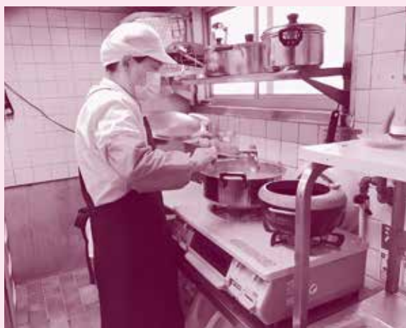
や お し ない ふく し しせつ ▲八尾市内の福祉施設

実施期間 12 月 1 日～12 月 31 日 (1 か月間)。ご協力いただきました募金は全てが八尾市内の地域福祉活動へ使われます。